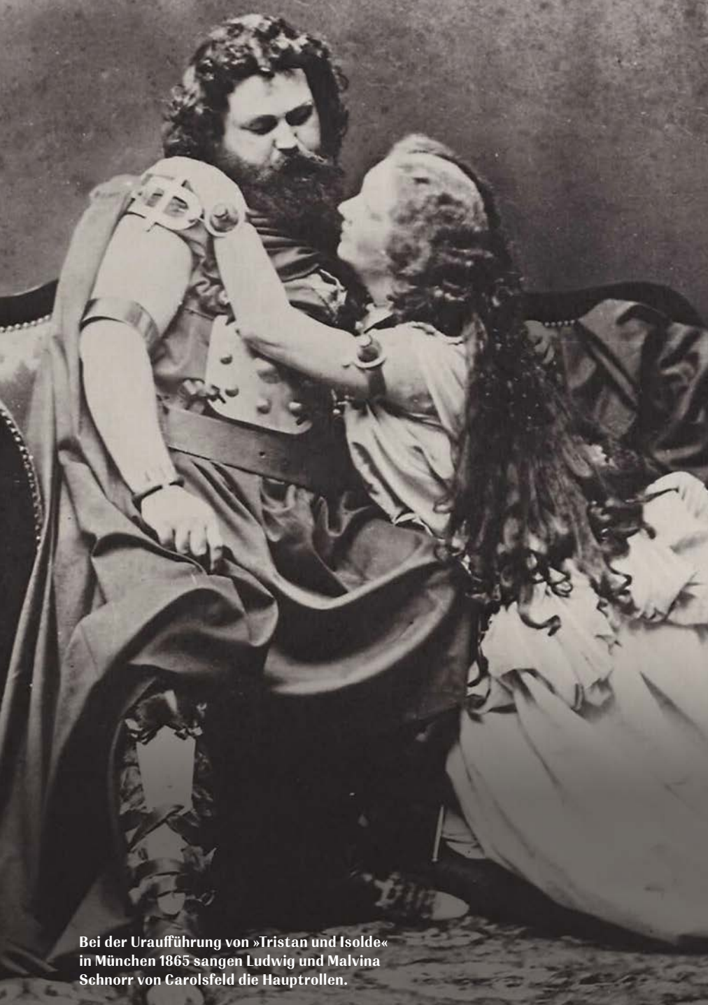
Bei der Uraufführung von »Tristan und Isolde« in München 1865 sangen Ludwig und Malvina Schnorr von Carolsfeld die Hauptrollen.