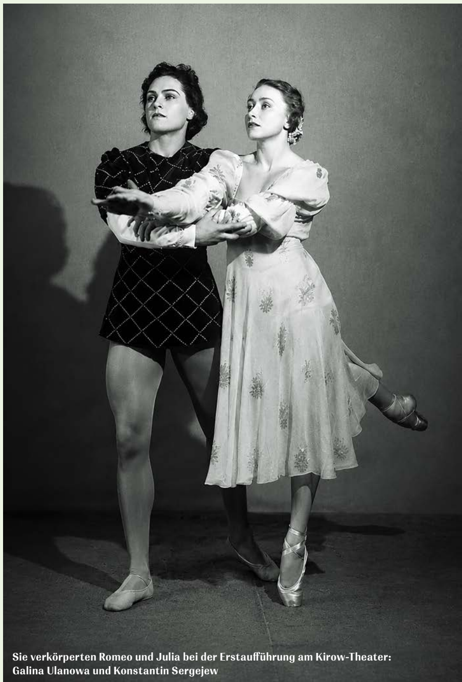
Sie verkörperten Romeo und Julia bei der Erstaufführung am Kirow-Theater: Galina Ulanowa und Konstantin Sergejew